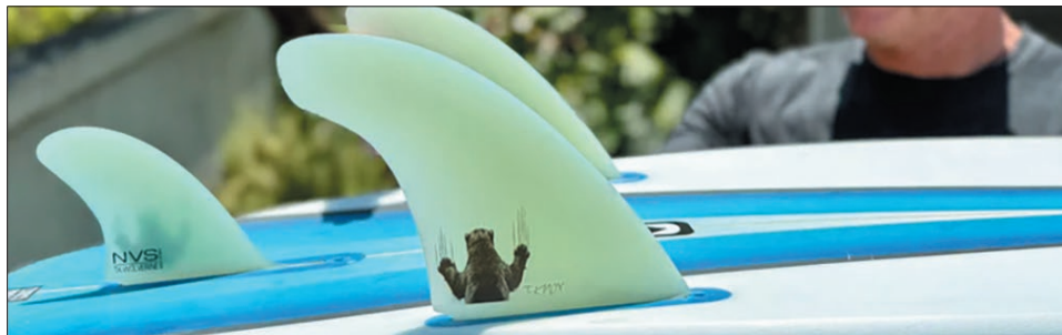
NEW TAYLOR KNOX WOLVERINE TWIN